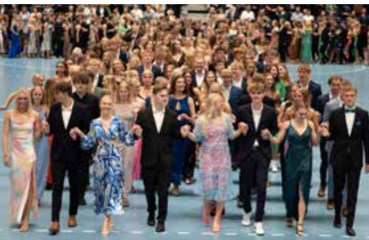
Indmarch til lanciers i JYSK Arena.

På samme måde som naturen følger årets gang, har vi på Silkeborg Gymnasium også en årlig cyklus. Et årshjul, der ligger inden i et større treårigt hjul. Det hele starter en morgen i august med den første skoledag i 1.g, hvor eleverne møder hinanden for første gang – nysgerrige, forventningsfulde, med sommerfugle i maven, men alligevel parate til at møde alt det nye. Og de 500 elever i 3.g, der mødte på SG for første gang den augustmorgen i 2019, er nu i fuld gang med at afslutte det tredje årshjul og dermed gymnasietiden.