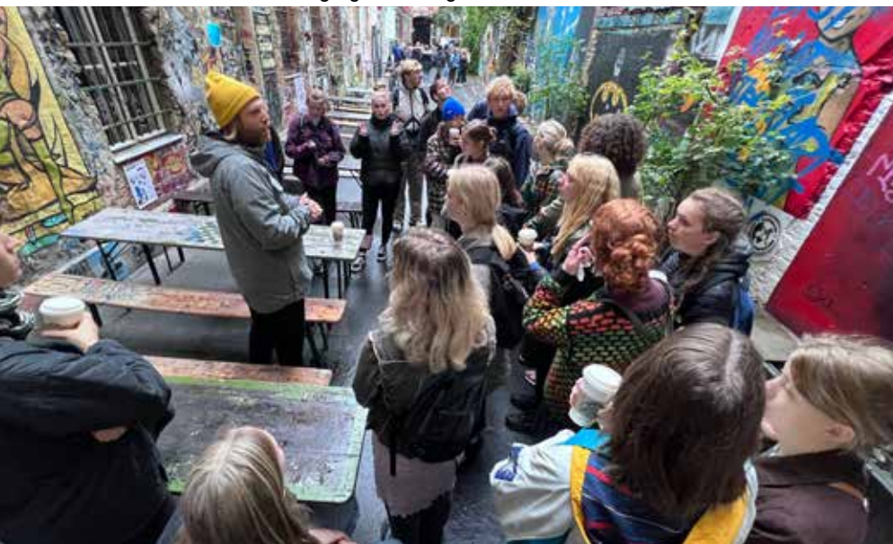
3.c, 3.d og 3.m på studietur til Berlin

Der bliver dog også tid til spændende, fælles afbræk såsom en temadag om elevdemokrati og det gode gymnasieliv, ligesom der afholdes en temadag for elever i 2.g og 3.g med titlen "Red verden på 48 timer" med Clement Kjersgaard i spidsen. Og så afholdes der selvfølgelig gallafest og Jule-Skrymer.