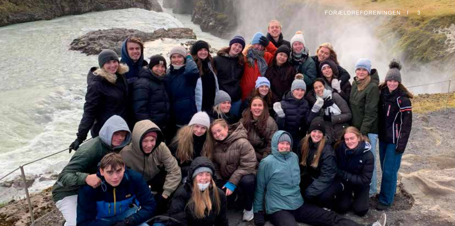
I efteråret 2021 blev det igen muligt at tage på studierejser. Her 3.s på Island