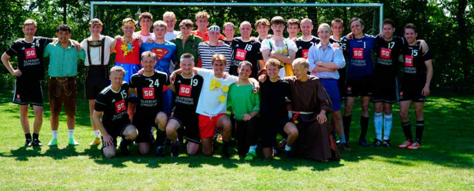
Den traditionsrige fodboldkamp mellem lærere og 3.g'ere på sidste skoledag.