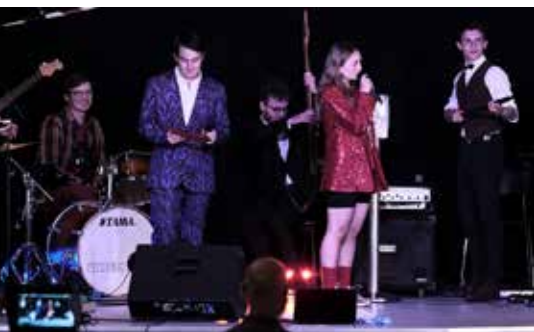
En stor gruppe elever lagde en kæmpe indsats i at lave et flot show til 3.g'ernes sidste skoledag.

Sådan skrev jeg på denne plads for to år siden, da de kommende studenter gik i 1.g. Som tidligere årgange har de set frem til dette forår, til nedtællingen, til sidste skoledag, til lanciers, dimission og studenterkørsel.